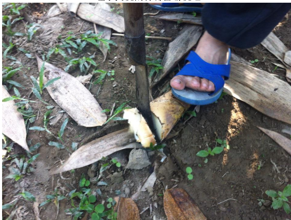
理事長現刮竹筍當場現吃