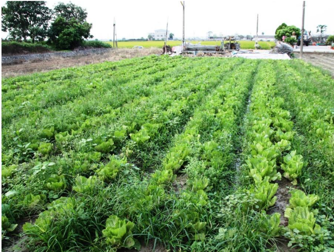
蘇理事長的酸菜田散落尼姑庵社區