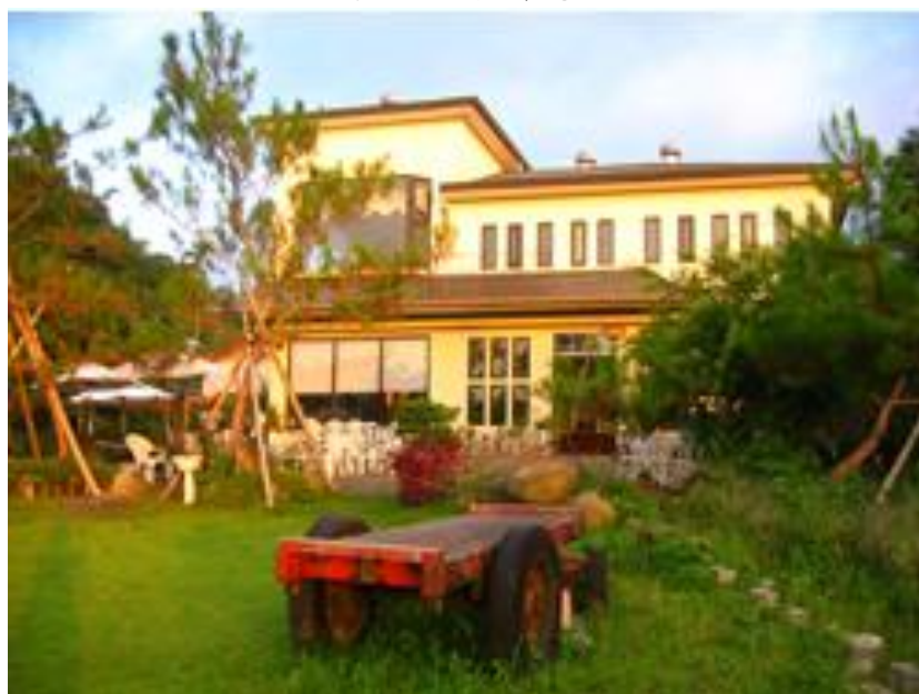
民宿庭園相當寬敞