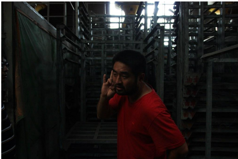
堆滿工廠的穀物正準備烘