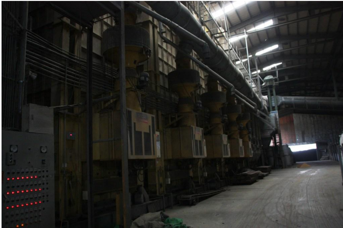
堆肥場的占地相當可觀